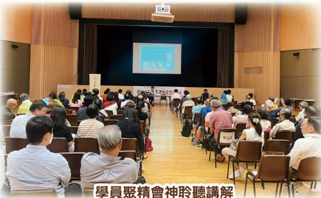
學員聚精會神聆聽講解 Participants attentively listening to the explanation

Eastern District Building Management Training Course