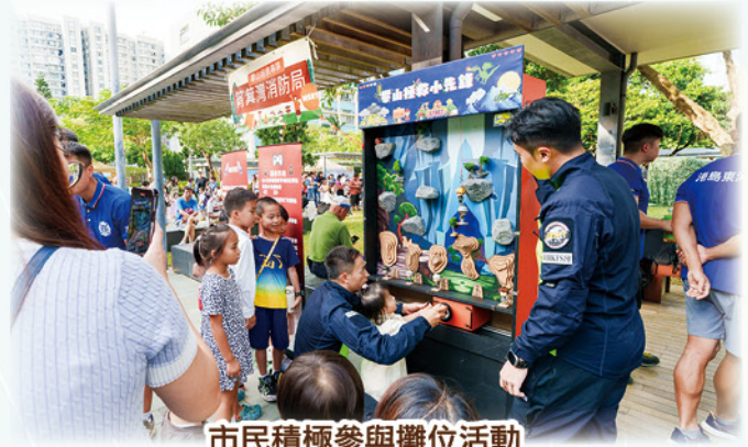
市民積極參與攤位活動 Citizens actively participating in booth activities