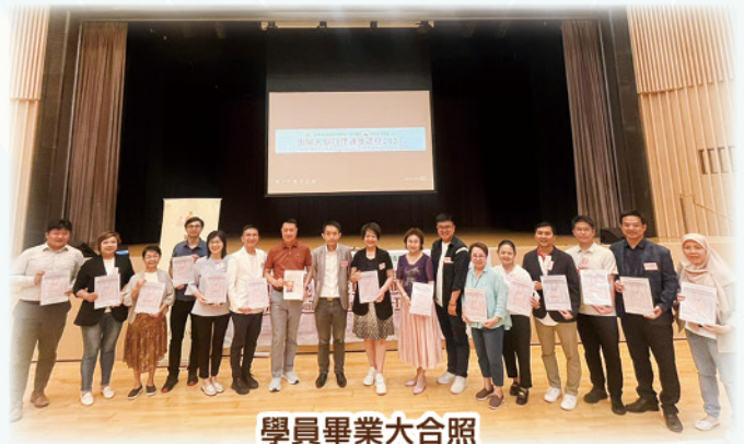
學員畢業大合照 Graduation group photo of the participants