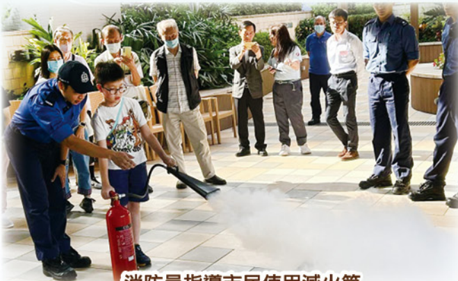
消防員指導市民使用滅火筒 Firefighters guiding citizens on how to use fire extinguishers