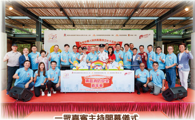
一眾嘉賓主持開幕儀式 Opening Ceremony

Eastern District Fire Safety Carnival in Celebration of the 75th Anniversary of the Founding of the People's Republic of China