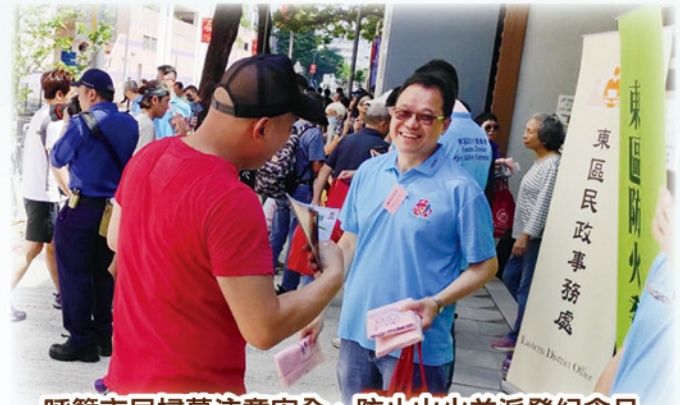
呼籲市民掃墓注意安全、防止山火並派發紀念品 Calling on citizens to pay attention to safety when visiting graves, prevent wildfires, and distributing souvenirs

Chung Yeung Festival Hill Fire Prevention Publicity Activity